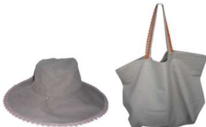
Cappello e shopper con bubolino, in lino rispettivamente tortora e corda, linea BUBBO..LINO