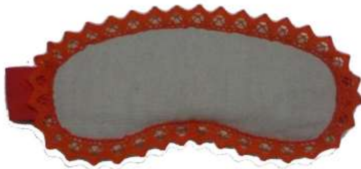
Nella foto: mascherina con noccioli di ciliegia, in lino corda, linea BUBBO..LINO.

La novità assoluta di questa collezione è rappresentata dalla linea BUBBO...LINO .