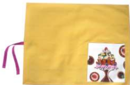
Tovaglietta VITTORIA con tasca porta-posate, in cotone con motivo piazzato, linea TORTE. Dimensioni: 35x45cm

Asciughino ALESSIO, in cotone con taschino porta utensili, giallo con tasca con motivo piazzato, linea TORTE.