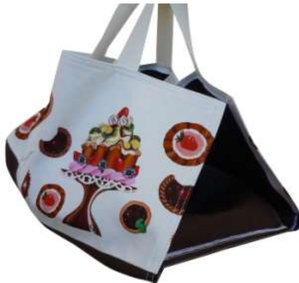
Nella foto: GIULIA, porta-torte in cotone stampato. Linea TORTE.

Sempre realizzata in collaborazione con Donatella Isola, la linea TORTE è nata dall'idea di ricreare in chiave ironica il sapore di una sala da the ai tempi di Maria Antonietta attraverso una stampa fatta di stuzzicanti tortine, squisiti gateaux e gustosi pasticcini che accompagnano chiacchiere e pettegolezzi da salotto: un'atmosfera "bon ton" in stile contemporaneo.