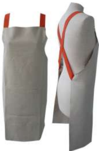
Grembiule con spalline incrociate in elastico, in lino corda, linea BUBBO..LINO