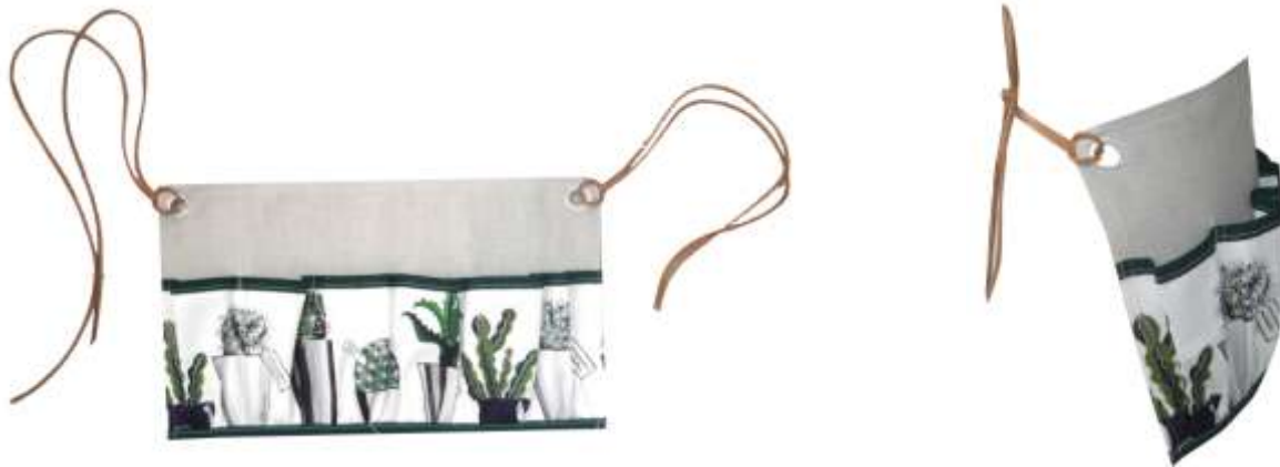
Nella foto: GUIDO, grembiolino porta utensili in jeans e cotone . Linea JUICY.