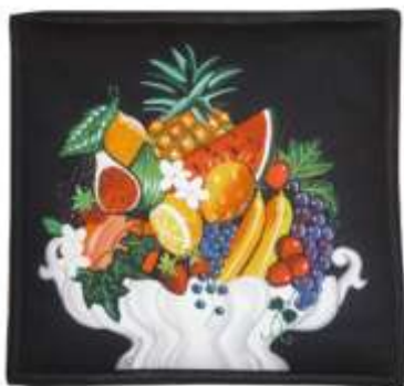
Sottopentola ISOLDA, in cotone imbottito, motivo piazzato, linea TUTTIFRUTTI

Tra i modelli, alcune novità: a fianco della tovaglietta con taschino porta-posate, presentata la scorsa stagione, nasce la tovaglietta con porta-tovagliolo; entra nella collezione anche il portapane con incorporati i noccioli di ciliegia per mantenere calde le focaccine dei pranzi estivi, la "presona" - sottopentola, in abbinato ai grembiuli con la molla ed infine il portaoggetti da muro, da appendere in cucina per riporre i mestoli o vicino al BBQ per contenere le spezie.