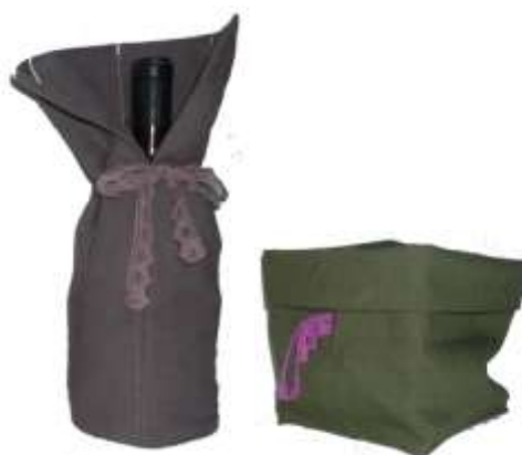
Porta bottiglia e portapane con noccioli di ciliegia, in lino rispettivamente tortora e verde, linea BUBBO..LINO